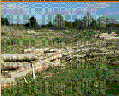
Eclaircie de taillis (Nièvre)

En particulier lorsque les brins sont de trop petits diamètres pour permettre une exploitation en bois rond (bois de chauffage ou trituration).