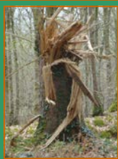
Dommages causés par la Tempête Xynthia en 2010

Tarifs très compétitifs : en moyenne 40 % inférieur aux autres assureurs français