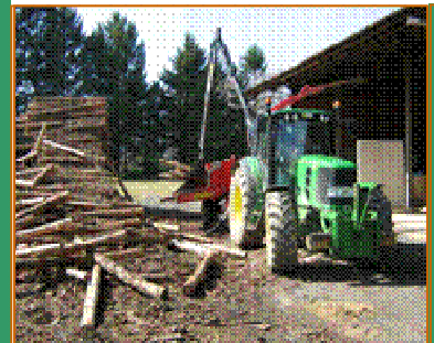
Broyage sur plateforme d'épicéas secs (Cantal)