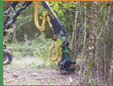
Coupe rase de taillis inexploitable avant reboisement (Corrèze)